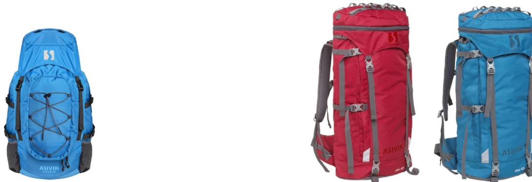
Ny type Asivik Hiker 40L med sidelommer

NB mikrospejderen skal på juleturen ikke bære rygsækken særligt langt (200-500 m), men på F.eks. MUS-lejren skal den bæres hjemmefra i tog, bus og ca. 500 m fra bussen til lejrpladsen.